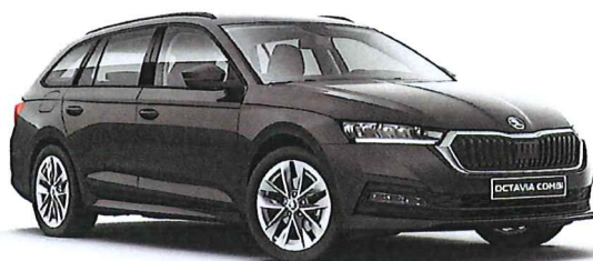
ilustrační foto vozu

výkon motoru : 85 kW / 116 PS převodovka : 6stupňová manuální