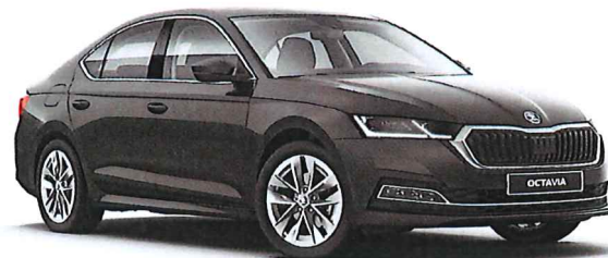
ilustrační foto vozu

výkon motoru : 110 kW / 150 PS převodovka : DSG - 7stupňový automat