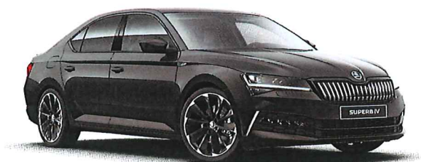
ilustrační foto vozu

výkon motoru : 110 kW / 150 PS převodovka : DSG - 7stupňový automat