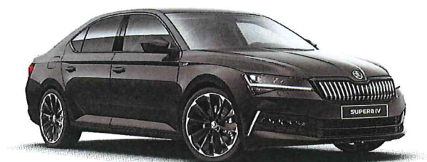
ilustrační foto vozu

výkon motoru : 140 kW / 190 PS převodovka : DSG - 7stupňový automat