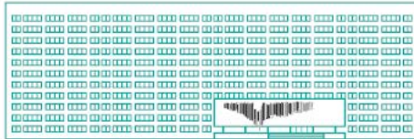
VSB – TECHNICAL UNIVERSITY OF OSTRAVA VSB 2 UO – Czech republic